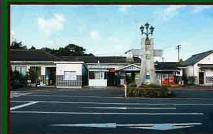
5 デンタルサポート大多喜駅 いすみ鉄道の本社と車両基地があります。