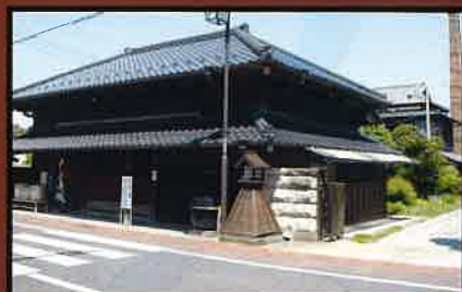
16 豊乃鶴酒造 1874年(明治7年) 国の登録有形文化財。 銘酒「大多喜城」の醸造元。