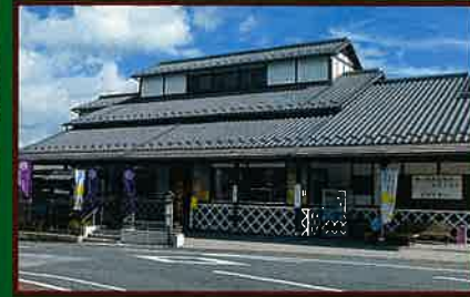
6 観光センター(観光案内所) 大多喜町の観光情報発信基地。 人力車(要予約)、レンタルサイクル、会議 室などが利用できる。 大多喜の土産が販売されている。