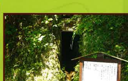
2 大多喜水道跡 千葉県最古の水道施設。江戸時代から計画され 1870年(明治3年)に完成した。 水路総延長 5,760m

忠勝公が掘ったもので、水が濁れたことが ないと言われている。 深さ20m 周囲17m