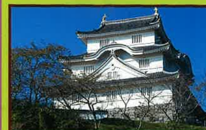
1 大多喜城(昭和50年復元) 徳川四天王の一人本多忠勝が1590年(天正18年) に築城 休館日:毎週月曜日、年末年始、臨時 休館あり