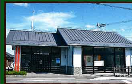
7 休憩 天然ガス記念館 館内には上総掘りの模型や、天然ガスに関する 歴史等の資料が展示されている。 休憩、待合せにもご利用できる。