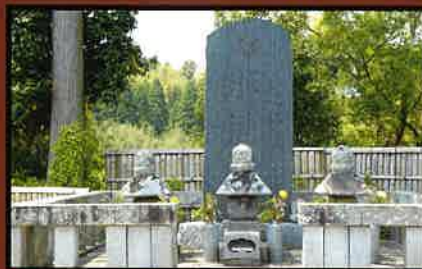
22 本多忠勝公墓所(町指定史跡) 忠勝公(中央)、忠勝公夫人(右)、次男忠朝公(左)。