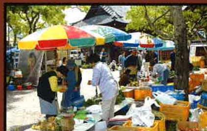
20 夷隅神社でおこなわれる朝市(六齋市) 毎月5と10のつく日に開催されている。(午前中)