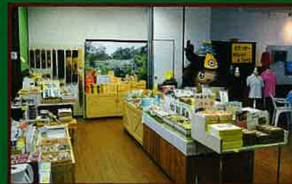
6 観光センター 館内 館内には各種観光パンフレットが置かれており、 大多喜町の物産品やいすみ鉄道グッズなどが販 売されている。