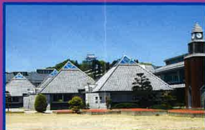
15 大多喜小学校 1997年 千葉県建築文化賞