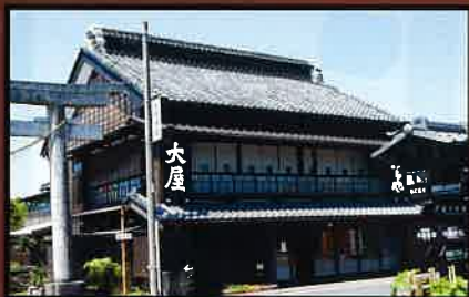
18 大屋旅館 国の登録有形文化財。 江戸時代から旅館として創業。