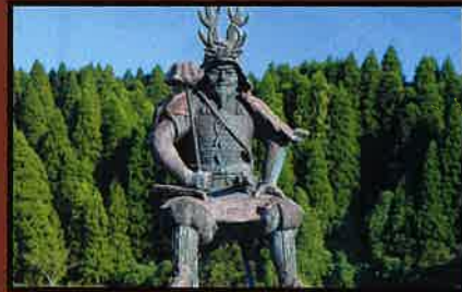
23 本多忠勝公銅像 行徳橋の親柱に設置された忠勝像