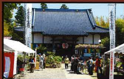
17 妙勝寺(ポタンの花) 花の見頃は4月中旬から下旬。