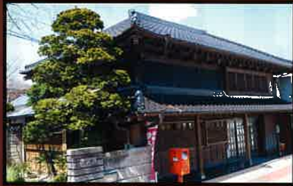
21 穴倉邸 1874年(明治7年)頃 国の登録有形文化財。 醤油の醸造場所と商店兼住宅として建築された。