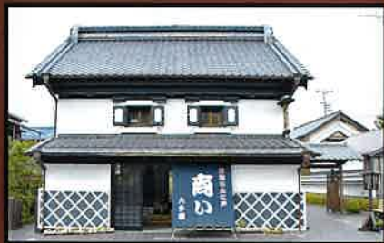
13 商い資料館 町並みの中心にあり、江戸～明治の資料が展示されている。 見学自由