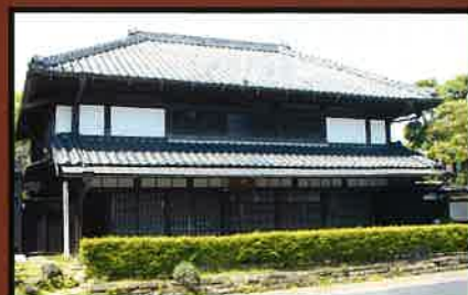
9 渡辺家住宅(国指定重要文化財) この建物は1849年(嘉永2年)に建築された江戸時代後期の町家である。