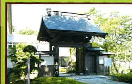
4 薬医門(県指定史跡) 江戸時代中期の城内御殿の門。