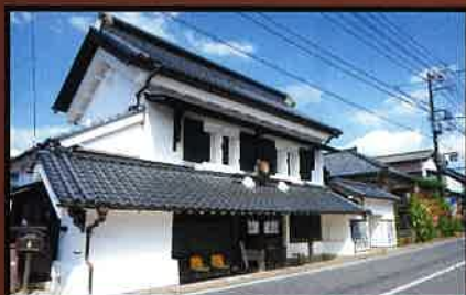
11 笠屋 土蔵造りの商家で質屋・金物屋を営業していた。