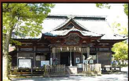
19 夷隅神社(町指定文化財) 歴代大多喜城主の崇敬社の一つで、現在の建造物は江戸時代末期のものと思われる。