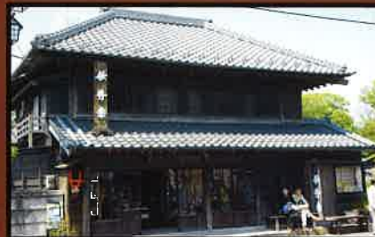
10 伊勢幸(酒店) 1872年(明治5年) 移築 大手門の材料の一部を使用して建築された商家で、屋根瓦に城主の紋所があった。