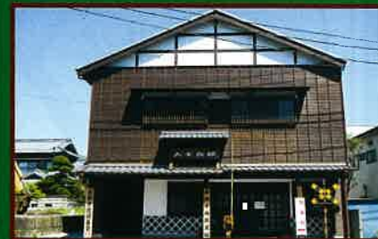
8 房総中央鉄道館(土日・祝日・開館、入館料有料) 動く鉄道模型、駅名板等、鉄道グッズ1,000点 を常設。