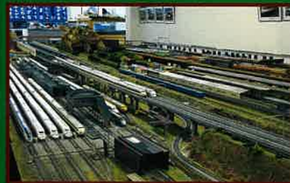
8 房総中央鉄道館 館内 館内に設置された鉄道のジオラマ。 土・日・祝日開館、年末年始及び臨時休館あり。